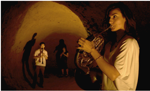
Musik in der Grotte