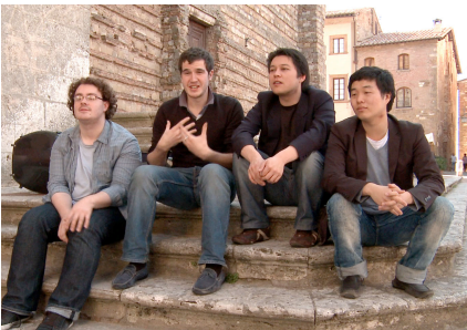
Idomeneo - Quartett