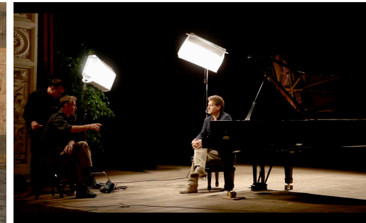
Interview mit Andrea Lucchesini