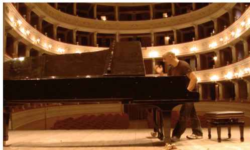
Klavieraufbau im Theater Poliziano