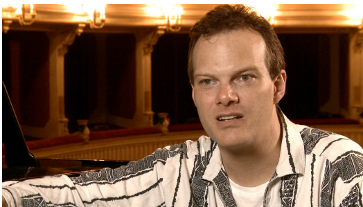
Interview mit Lars Vogt