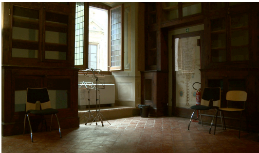
Stimmung im Palazzo Ricci